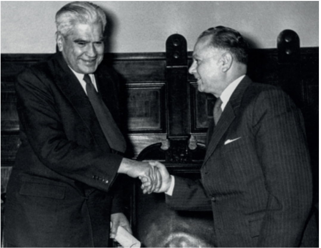
Recepción del Premio Nacional de Literatura, con el Ministro de Educación M. Quintana, 1957