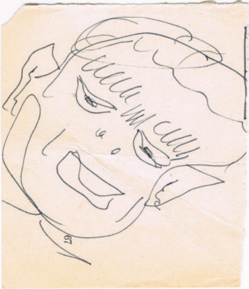
Manuel Rojas, dibujo de Carlos Droguett