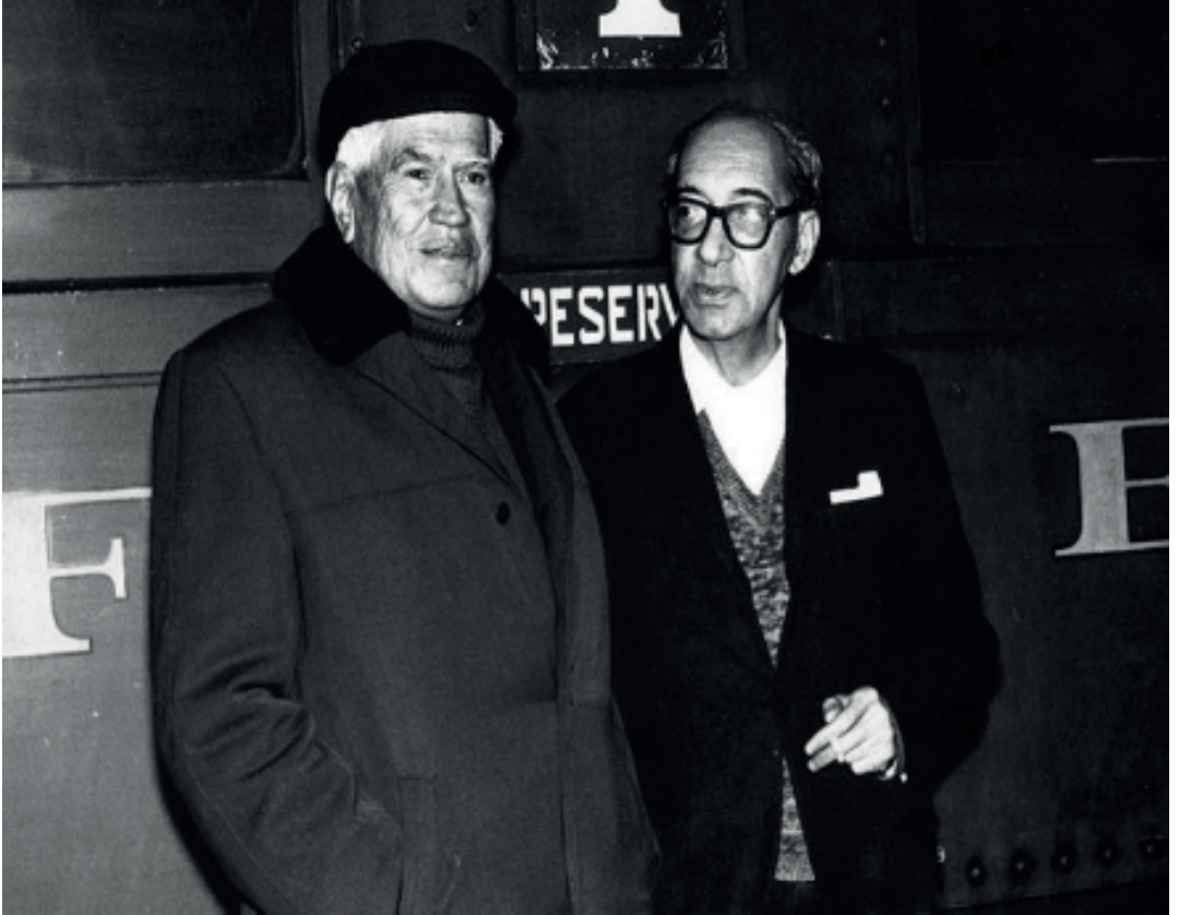
Con Juan Carlos Onetti, 1970