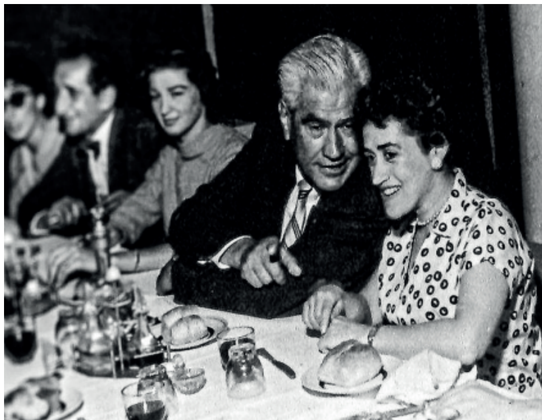
Con Isidora Aguirre, 1958