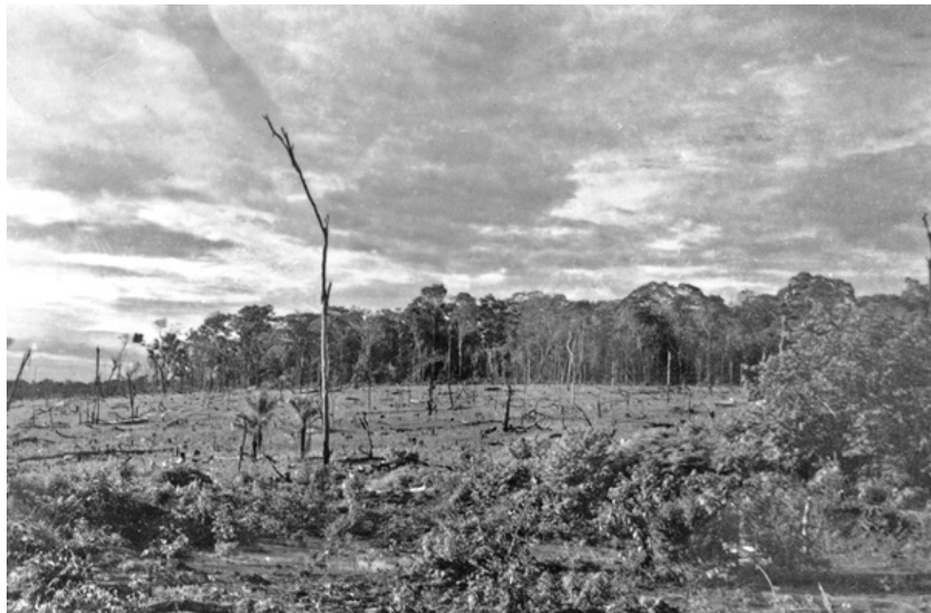
FIGURA 2: ROÇA DE ARROZ, MATO GROSSO DE GOIÁS, NAS PROXIMIDADES DE GOIÂNIA (GO), 1957

Autores: Tibor Jablonsky e Speridião Faissol, 1957. Fonte: Acervo dos trabalhos geográficos de campo, Biblioteca Central do IBGE, IBGE, 1957.