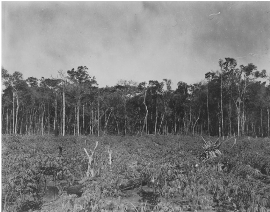
Foto: Carlos de Castro Botelho e Tomas Somlo, 1953. Fonte: Acervo dos trabalhos geográficos de campo, Biblioteca Digital, IBGE.

Em linhas gerais, a imprensa goiana (capital e interior) defendia o ideário político da “Marcha para o Oeste” e, principalmente, os benefícios gerados pelas estradas. A CANG, por sua vez, era divulgada pelo governo federal como uma bem-sucedida ação da política de colonização, desviando o foco das questões de migração e povoamento e concentrando-o na temática do desenvolvimento regional. Distintamente dos articulistas do governo federal, que relacionavam os projetos de imigração e colonização às políticas trabalhistas de Vargas, a imprensa goiana via na CANG a possibilidade de desenvolvimento e de maior integração regional. Assim, nos discursos sobre a ocupação da MSP, as qualidades do solo, o rápido avanço demográfico, as obras de infraestrutura, sobretudo no campo rodoviário, eram promessas de desenvolvimento econômico.